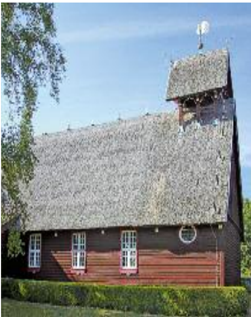
Am 7. April 1935 wurde die Fischerkirche in Born feierlich geweiht.